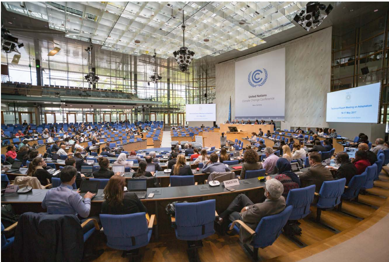
COP 23 – UN Climate Change Conference November 2017.

kommer en mer grundläggande analys av detta komma i IPCCs Assessment Report 7. Tills vidare, för att inte behöva riskera att krympa budgeten senare, har vi därför valt att ha kvar AR6 som utgångspunkt vid beräkning av budgetar och utsläppsminskningstakt. Det skulle då potentiellt innebära att utsläppsminskningstakten i denna rapport ökar sannolikheten för att nå betydligt under för 2,0 gradersmålet och att nå 1,5 gradersmålet.